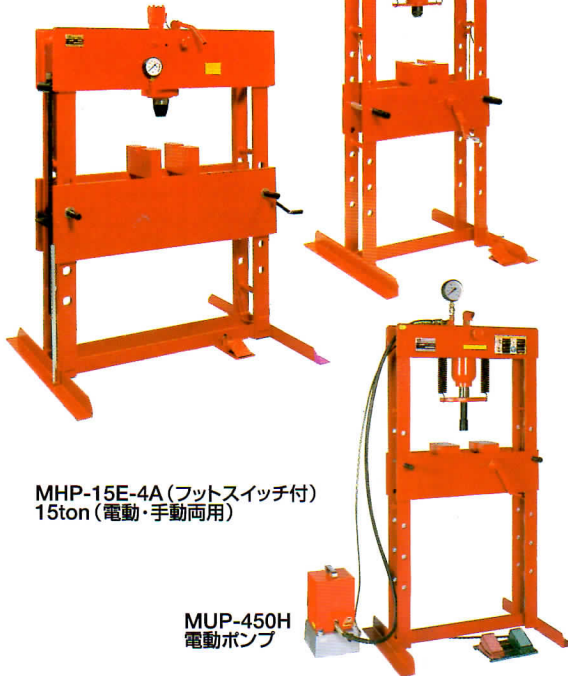
MHP-15E-4A (フットスイッチ付) 15ton (電動・手動両用)