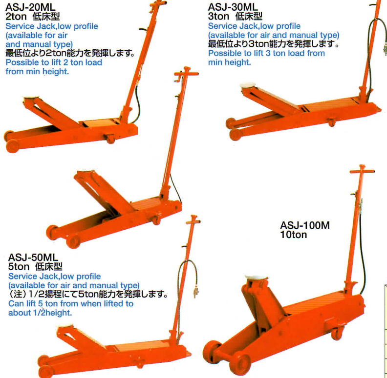
ASJ-20ML 2ton 低床型

Easy operation by push-button, especially for use in narrow place.